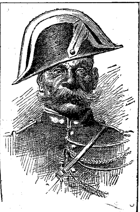
«Ο ένωμοτάρχης ώνομάζετο Πάνδωρος...» (Σελ. 390, *στ. γ')