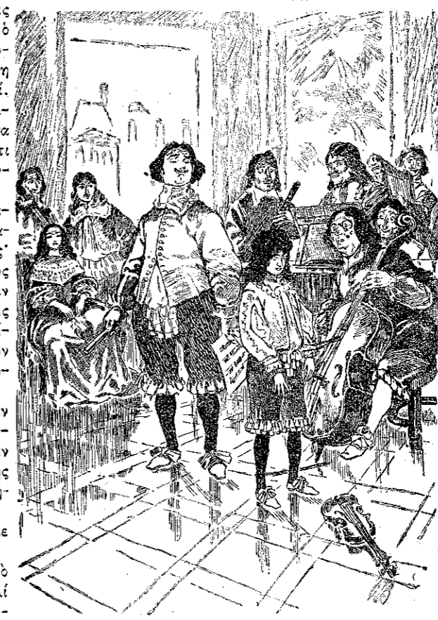
"Ο Λούλλης άφίνει τόν όργανον να πείση από τās χείρας του...» (Σελ. 393, στ. γ')

"Ο Λούλλης, έν τώ μεταξύ, άπορών διά τήν βίαν μεθ' ής ό αρχιμουσικός